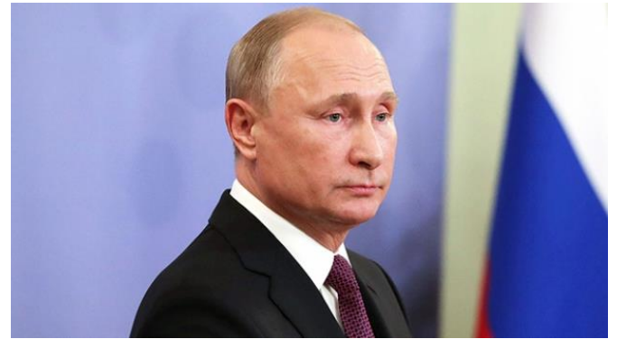
Rusya Devlet Başkanı Vladimir Putin, Sırp basınına verdiği röportajda Türk